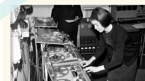
Delia Derbyshire

Certaines de ces mélodies sont inspirées des musiques orientales, des rythmes de l'Inde ou de l'Afrique. La compositrice britannique Delia Derbyshire , dans Pot au feu (1968), utilise plusieurs de ces idées: le synthétiseur (un instrument électronique) et le séquençage, grâce auquel elle coupe les sons en petits morceaux pour multiplier les possibilités de les organiser et les réorganiser.