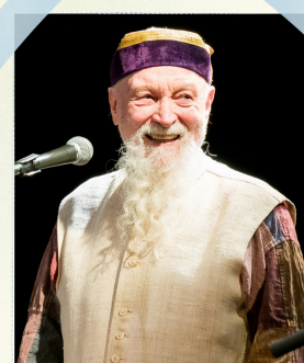
Terry Riley

Le courant musical minimaliste fait partie d'un mouvement artistique plus vaste qui associe les arts visuels 2 (dessins, peinture...), le théâtre et la danse. Par exemple, l'opéra Einstein on the Beach (1976) est une collaboration entre le compositeur Philip Glass 3 , le metteur en scène Bob Wilson 4 et la chorégraphe Lucinda Childs 5 . Cette musique est beaucoup utilisée au cinéma, car elle contribue à construire le suspense et la tension.