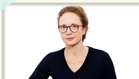
Rebecca Saunders

Dès les origines, les compositeurs minimalistes ont cherché à simplifier la musique contemporaine occidentale en la débarrassant d'une trop grande complexité. Le minimalisme ne s'élabore pas seulement en opposition à celle-ci, mais aussi en s'inspirant des cultures extra occidentales (Afrique, Inde) ou de la musique baroque, par exemple. Il acquiert progressivement des caractéristiques qui lui sont propres.