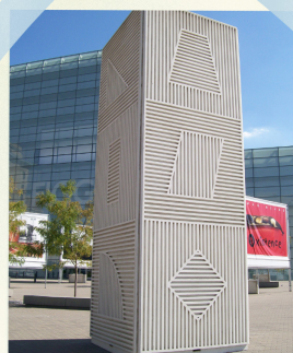
Sol LeWitt, Tower (1984)

Après l'œuvre fondatrice In C de Terry Riley en 1964, les premiers compositeurs minimalistes sont bientôt suivis par d'autres, tels que Steve Reich 6 et Philip Glass. Ils utilisent des éléments de la vie urbaine du XX e siècle, comme la répétition ou les bruits ambiants (trains, outils, voitures, voix, rires...). Tous créent des musiques où la récurrence (le retour régulier d'un élément sonore identique) est fondamentale. Ils répondent ainsi à des travaux d'artistes plastiques (créateurs d'œuvres visuelles par des techniques variées, de la sculpture à la photo) comme Sol LeWitt 7 , Carl Andre 8 ou Dan Flavin .