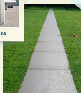
Carl Andre, 43 Roaring forty