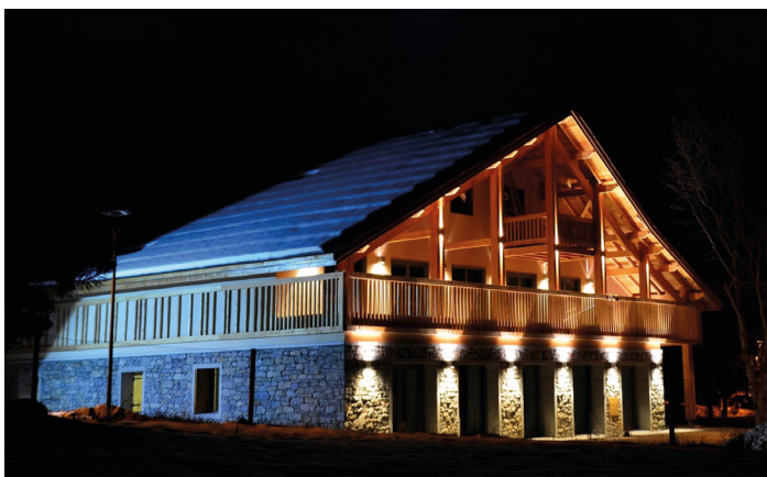
Le Fayore, salle municipale où auront lieu les séances de l'Académie.

Le trajet, de la gare de Gap à Saint-Michel de Chaillol, sera assuré en voiture par l'équipe de l'Espace Culturel de Chaillol.